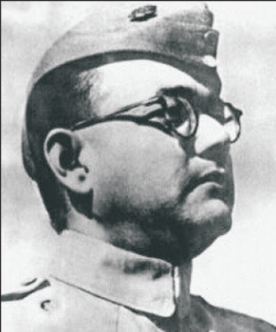
સુભાષચંદ્ર બોઝ જયંતિ (૨૩-૧-૨૦૧૬)