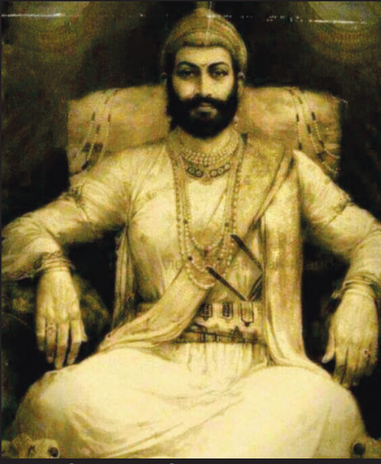
શિવાજી જયંતિ (૧૯-૨-૨૦૧૬)