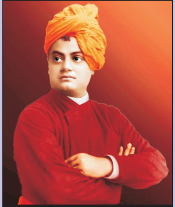
સ્વામી વિવેકાનંદ જયંતિ (૧૨-૧-૨૦૧૬)